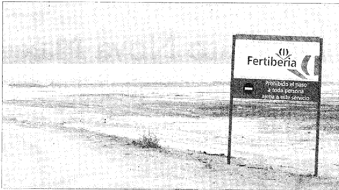
LA BALSAS DE FOSFOYESOS. La comisión multidisciplinar y plural estudiará una salida a los vertidos.

TCM-UGT Huelva está trabajando para que se reconozca a la policía portuaria como agente de la autoridad. Para ello, han presentado un paquete de enmiendas a los grupos parlamentarios sobre el anteproyecto de Ley de Puertos para su presentación en el Congreso de los Diputados.