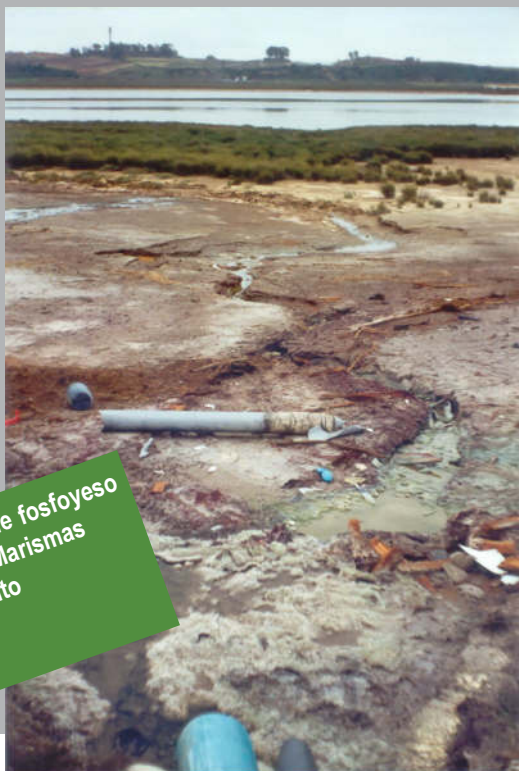
Balsas de fosfoyesos en las Marismas del Tinto