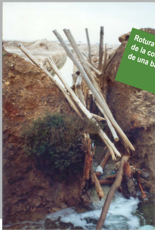
Rotura perimetral de la contención de una balsa