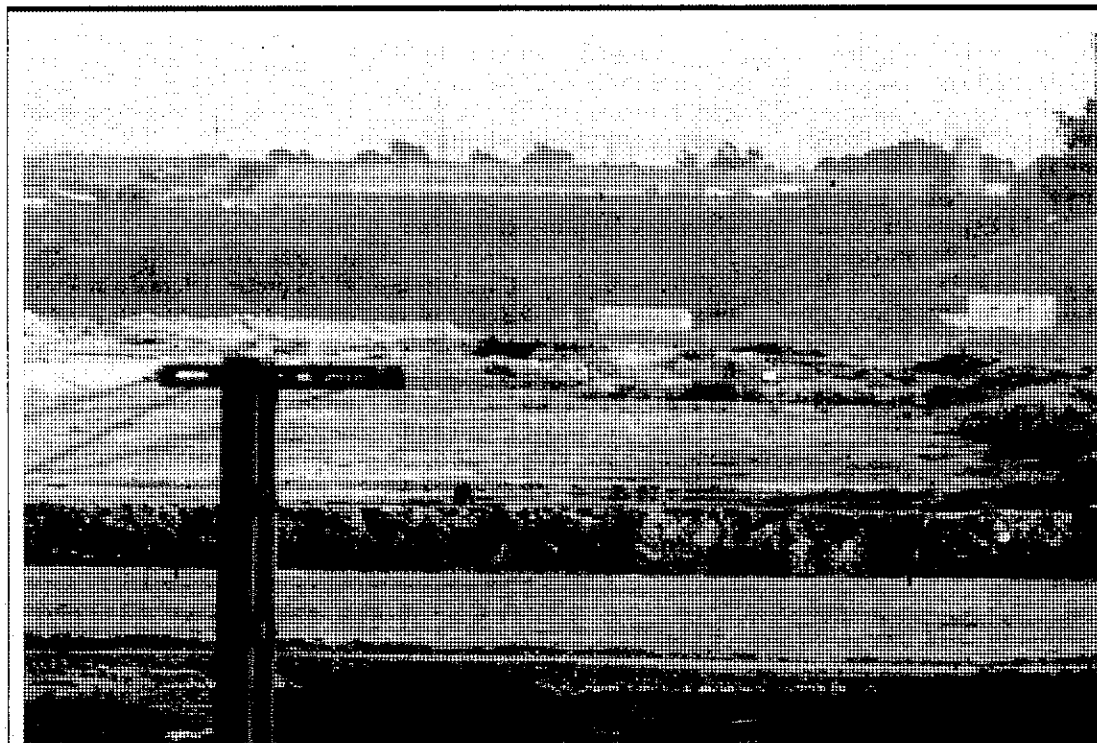
Depósitos de fosfoyeso de Fertiberia en la capital onubense.