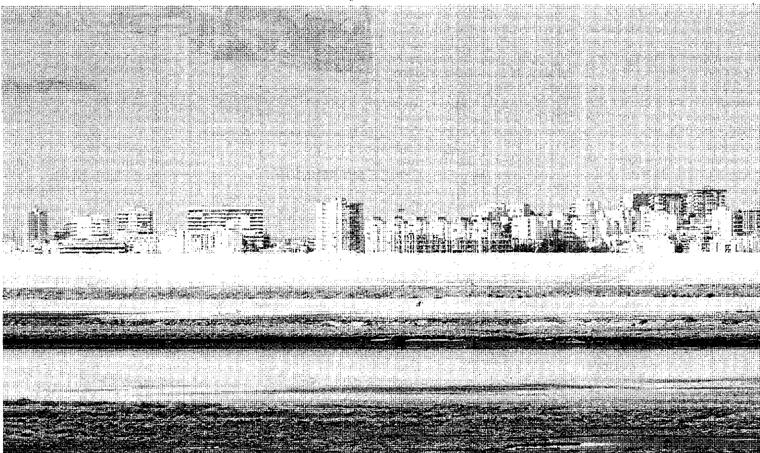
Vista de las balsas de fosfoyeso con la ciudad al fondo.

El adelanto en dos años de la fecha para el final de los vertidos de fosfoyeso afectará, y mucho, al proyecto que Fertiberia ha planteado para continuar su producción en Huelva a partir de 2012. Según el plan acordado por el Ministerio de Medio Ambiente y la empresa de fertilizantes, Fertiberia ha cesado ya el 50% de su producción de ácido fosfórico (reduciendo a la mitad los fosfoyesos generados) y a partir del 31 de diciembre de 2012 hubiese dejado de producir esta sustancia (materia prima para sus abonos), pasando a