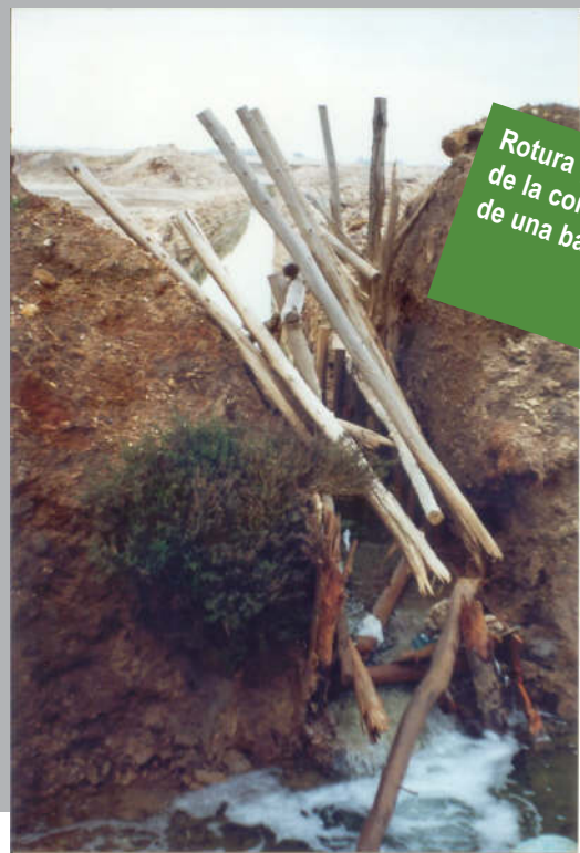
Rotura perimetral de la contención de una balsa