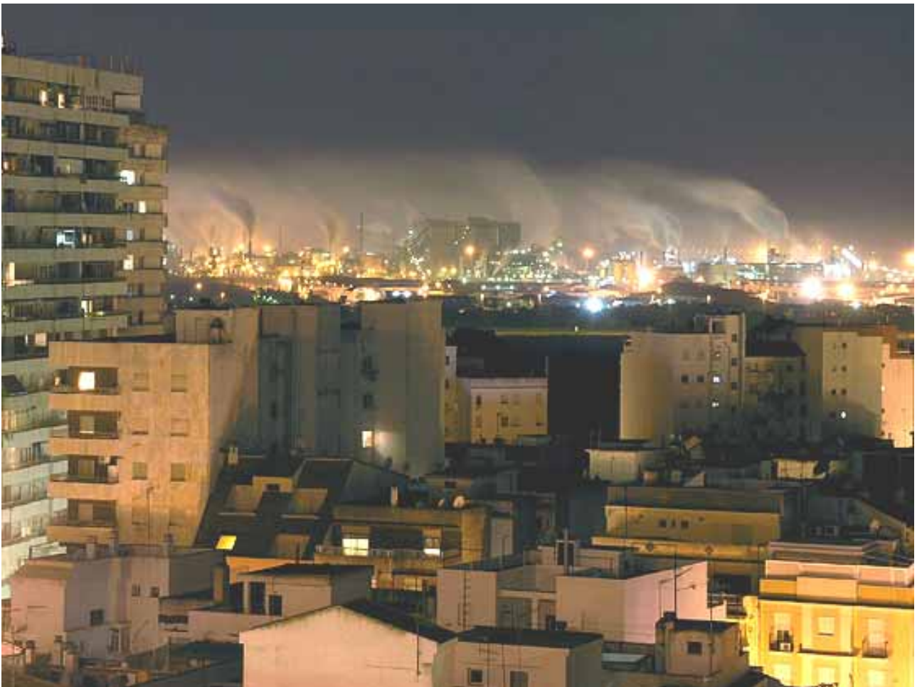
24-Noviembre-2004 – Desde Cabezo de la Esperanza

2004 Denuncia Mesa de la Ría a Inspección de Trabajo http://www.mesadelaria.org/denuncia_inspec_trabajo.pdf