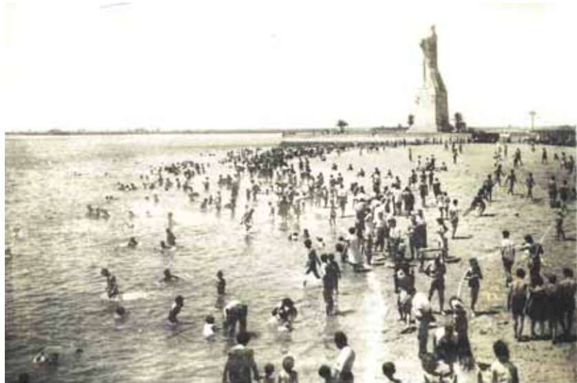
Playa de la Punta del Sebo en Huelva (desaparecida) Primera mitad de la década de los 60