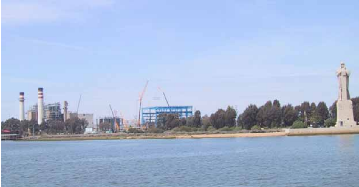
2005-04-20 - Detalle de obras de la Nueva Central sin Licencia, construyéndose gracias a una medida cautelar del TSJA. de Sevilla. El Plan General prohíbe nuevas industrias contaminantes en Punta del Sebo.

¡¡¡¡. Y, algunos (AIQB, FIA-UGT y Endesa), aún siguen manteniendo que se trata de una remodelación, o modernización .... !!!!