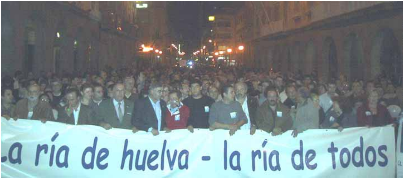
MANIFESTACIÓN 6N – 2003 – Mesa de la Ría – 12.000 personas

PESE A LOS POLÍTICOS QUE GOBIERNAN DE LA MANO DEL PODER FACTICO DE LAS MULTINACIONALES, ALGO ESTÁ CAMBIANDO EN HUELVA.