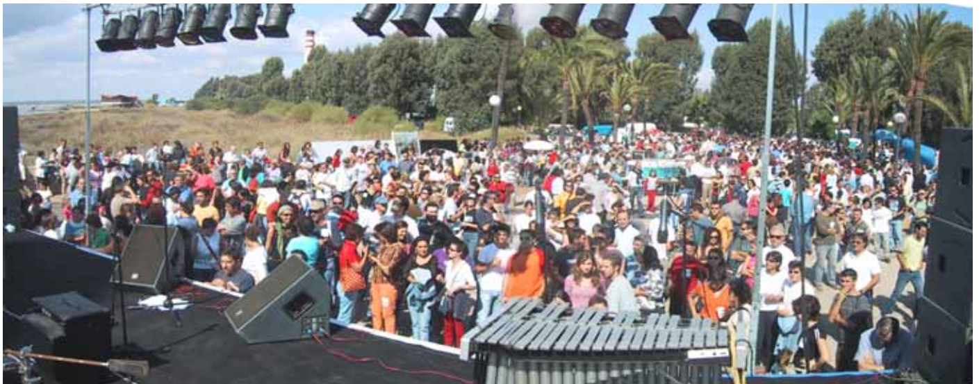
1ª GARBANZADA – 12 de Octubre 2004 – Mesa de la Ría – 20.000 personas de 12 h. de la mañana hasta las 12 h. de la noche.