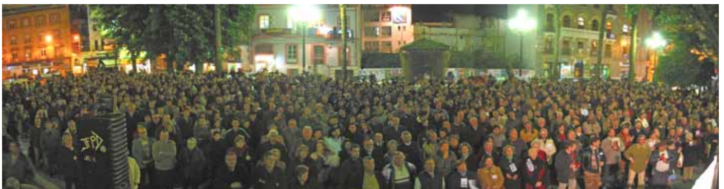
CONCENTRACIÓN 21-Febrero-2005 – Para exigir que el Alcalde recurra al Supremo la medida cautelar otorgada por el T.S.J.A. a ENDESA